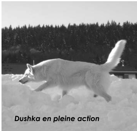
Dushka en pleine action

Heureusement pour Lise car il n'est pas facile de se trouver sous la neige, l'on y perd tous ses repères. Exercice bien réussi à la satisfaction du maître chien.